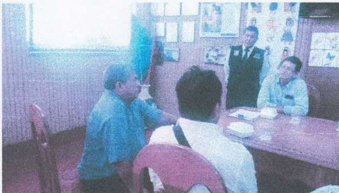
El señor Presidente del CODISEC, dio por concluida la 9na Sesión Ordinaria, del CODISE-SJB, correspondiente al mes de Setiembre 2016